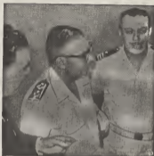
Aki nos ta mira e ministro brasileño di marina, Alcides Pedro Suzano (d e n centro) anunciando na Rio de Janeiro cu bapornan di gaza cu worde consid door di Francia lo worde rechazá.

Sin embargo, no tur pais a considera e limite aki satisfactorio y en vista di e multiple divergencianan, Naciones Unidas diferente buha nester a convocá reunionnan internascional pa trata na soluciona e asunto.